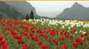
中川チューリップまつり

中川集落内をゆるやかに抜ける林道沿いに2万本のチューリップが植栽されて、癒しの景観を演出する新たなスポットとして楽しまれています。 時期 毎年4月の中旬 問 日之影町地域振興課 TEL:0982-87-3910